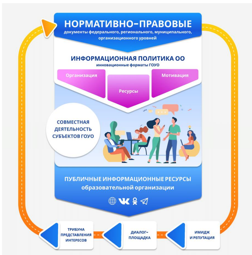
Рисунок 2. Концепция системы механизмов внедрения инновационных форматов ГОУО в ОУ

Общая схема, отражающая концепцию системы механизмов внедрения инновационных форматов ГОУО в ОУ, размещена ниже (рисунок 2).