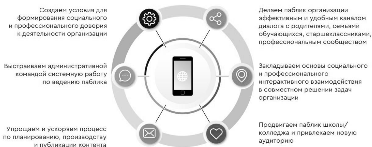
Рисунок 3 - Идеи контента

Логика и задачи, которые необходимо решать команде, представлены ниже (рисунок 3).